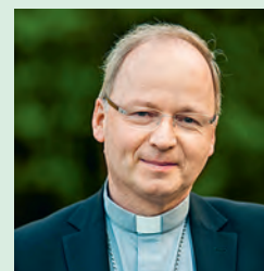
Ihr Bischof Benno Elbs

Ich danke Ihnen von Herzen für Ihr Engagement und Ihre Unterstützung!