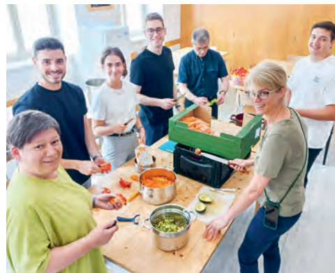
Beim Kochen entsteht Gemeinschaft.

Einrichtungen unterstützen. Das Sommerfest im Haus Amadou war mehr als nur ein Fest, es war ein Symbol der Solidarität und des Miteinanders. ■