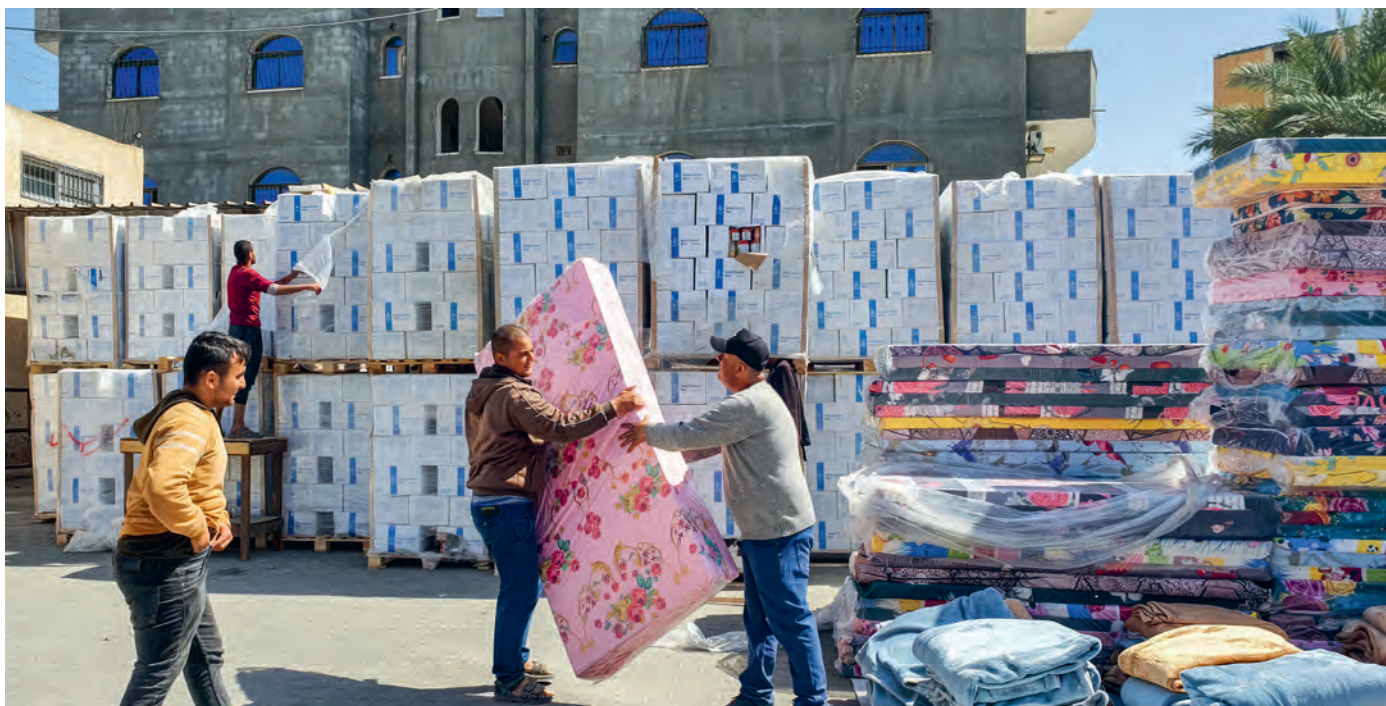
Ihre Spende leistet Akuthilfe für die Menschen im Gazastreifen.