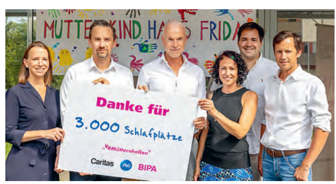
Die Aktion #mütternhelfen sicherte 3.000 Schlafplätze.

Unter der gebündelten Initiative #GemeinsamStärker ist Procter & Gamble auch in diesem Jahr wieder für hilfsbedürftige Menschen im Einsatz. Gemeinsam mit den Handelspartnern BIPA, BILLA und weiteren konnte die neue Spendenkampagne bereits 130.000 Euro für Einrichtungen der Caritas Österreich sammeln. Darunter 100.000 Euro für die Caritas Mutter-Kind-Häuser, wodurch im Rahmen der Aktion #mütternhelfen 3.000 Schlafplätze für Mütter und Kinder in Notsituationen gesichert wurden. Ein starkes Zeichen für mehr soziale Gerechtigkeit, Gleichstellung und Inklusion in Österreich. Vielen Dank an P&G, BIPA & BILLA für das langjährige Engagement!