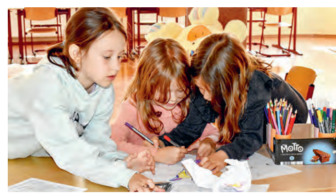
Dank der Unterstützung der Stepic CEE Charity können vulnerable Kinder in Rumänien einfach wieder Kind sein.

Ein großes Dankeschön für das langjährige Engagement!