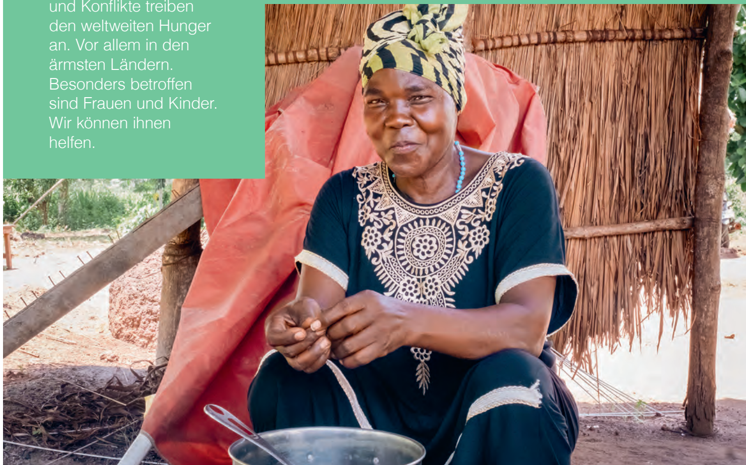
Dank landwirtschaftlicher Schulungen werden Familien nachhaltig satt.

Hunger. Klimakrise und Konflikte treiben den weltweiten Hunger an. Vor allem in den ärmsten Ländern. Besonders betroffen sind Frauen und Kinder. Wir können ihnen helfen.