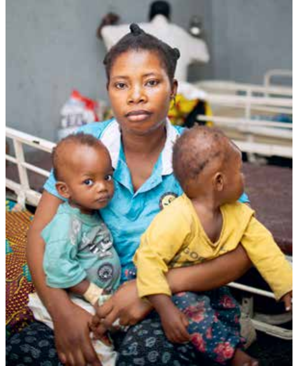
Eine Woche lang bleiben Ruths Zwillinge im Krankenhaus, danach erhält die Familie zweimal wöchentlich Nahrungspakete.